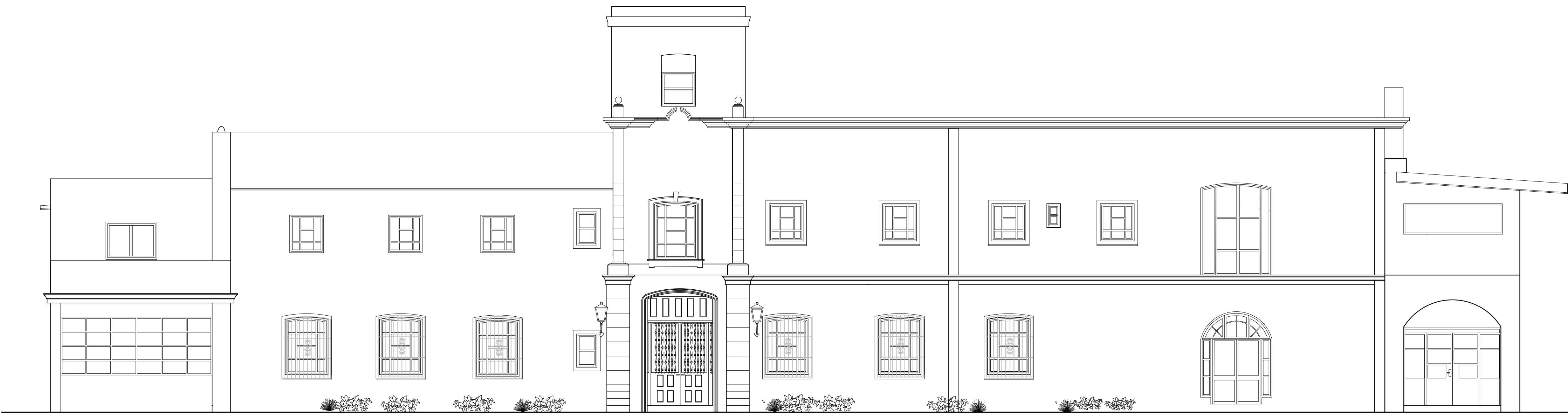
FACHADA PRINCIPAL ESC. 1:50